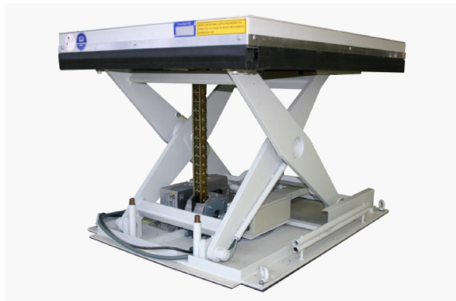
Žirklinis keltuvas su grandinine pavara