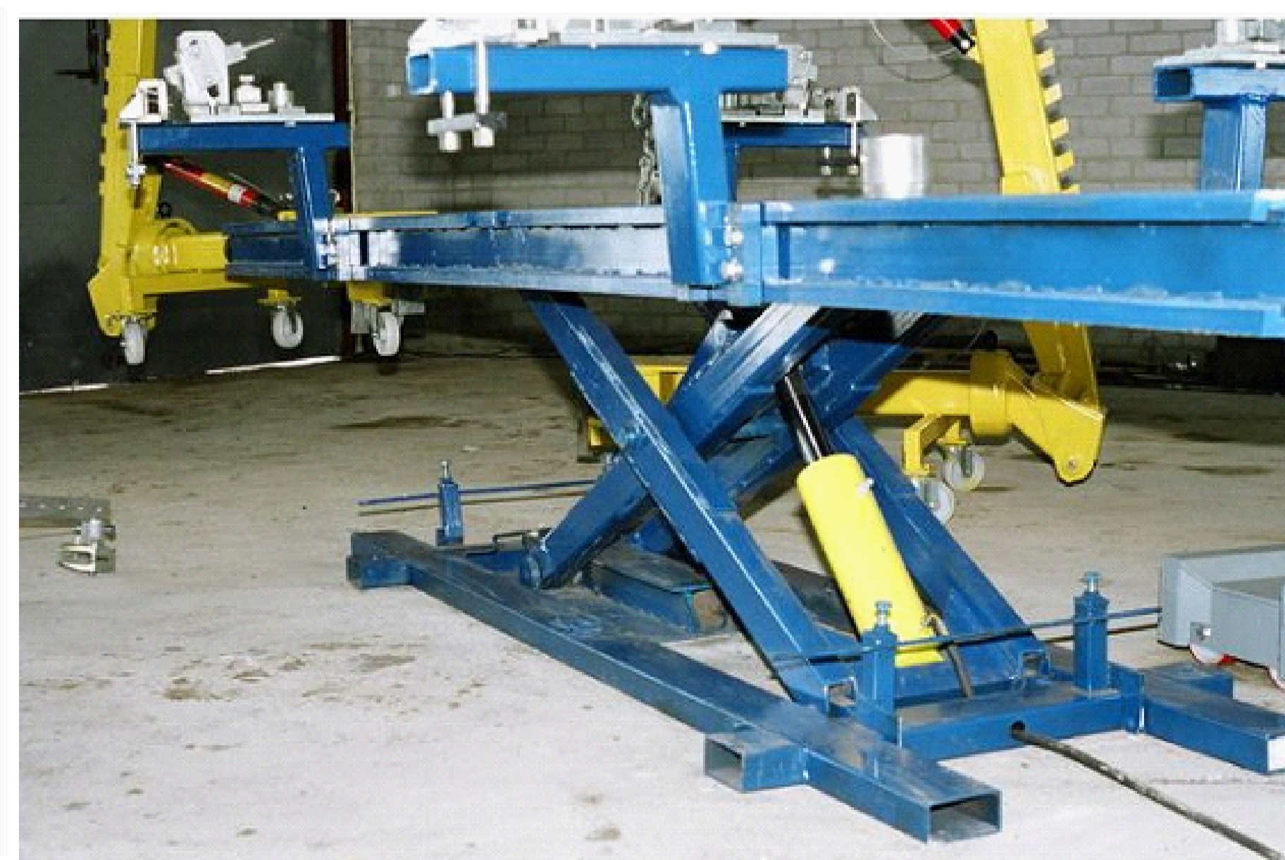
Žirklinis keltuvas su hidrauline pavara