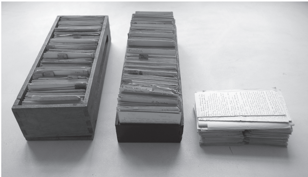
1 pav. M. Alseikaitės-Gimbutienės kartotekos kortelės (VUB RS, f. 154–503/1–3).