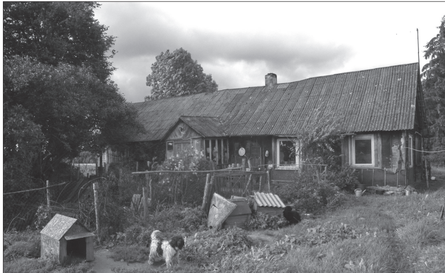
5 pav. J. Martinaičio gyvenamasis namas Kaneivaičių kaime, žvelgiant iš pietų. Mokykla veikė namo rytinėje dalyje, nuotraukos dešinėje. 2014 m. rugpjūčio 25 d.