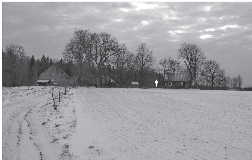
3 pav. Dambruskų sodyba – Dvarninkų kaimo viensėdis, žvelgiant iš šiaurės. Paženklinta bunkerio vieta nugriautoje gyvenamojo namo pusėje. 2014 m. vasario 1 d.