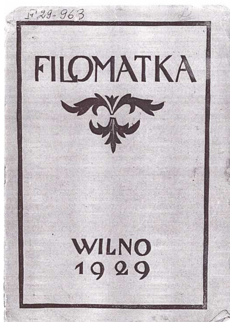
Ilustracja 3. Strona tytułowa gazетки „Filomatka” (1929).