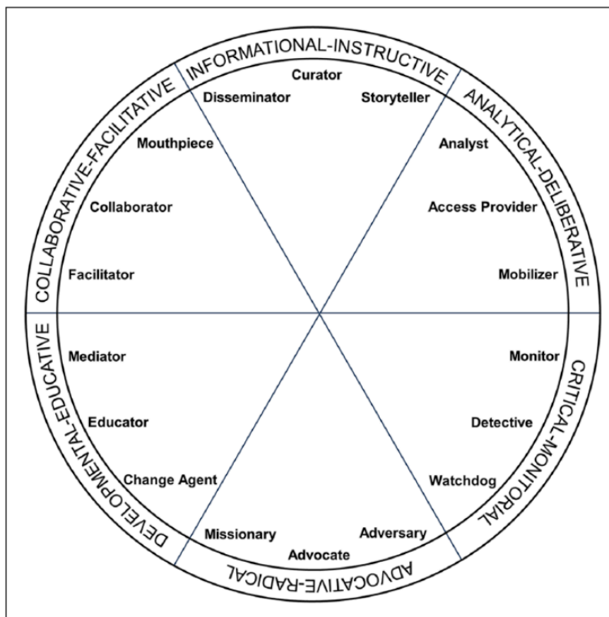
(Lentelė 3: Žurnalistų vaidmenys politinio gyvenimo srityje) 48