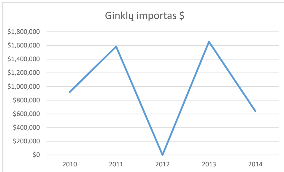
Priedas Nr. 3 150