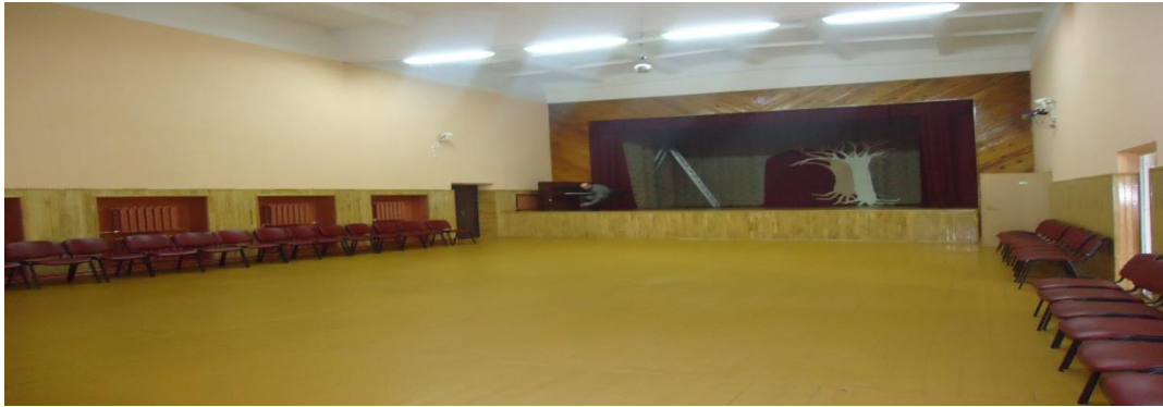
22. Nuotrauka . Šaukoto kultūros namai.

I. Grigaliūnaitės, fotografuota Šaukoto k., Radviliškio r. 2015 04 23