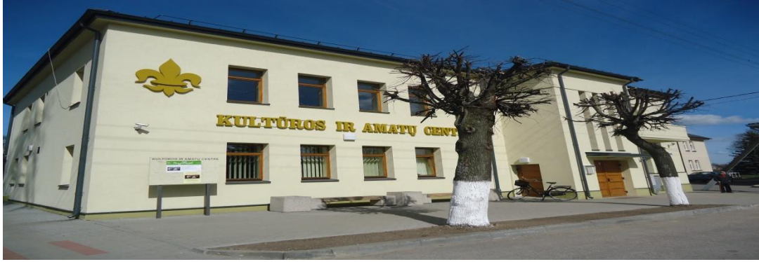
25. Nuotrauka . Šeduvos kultūros ir amatų centras.

I. Grigaliūnaitės, fotografuota Šeduva., Radviliškio r. 2015 04 23