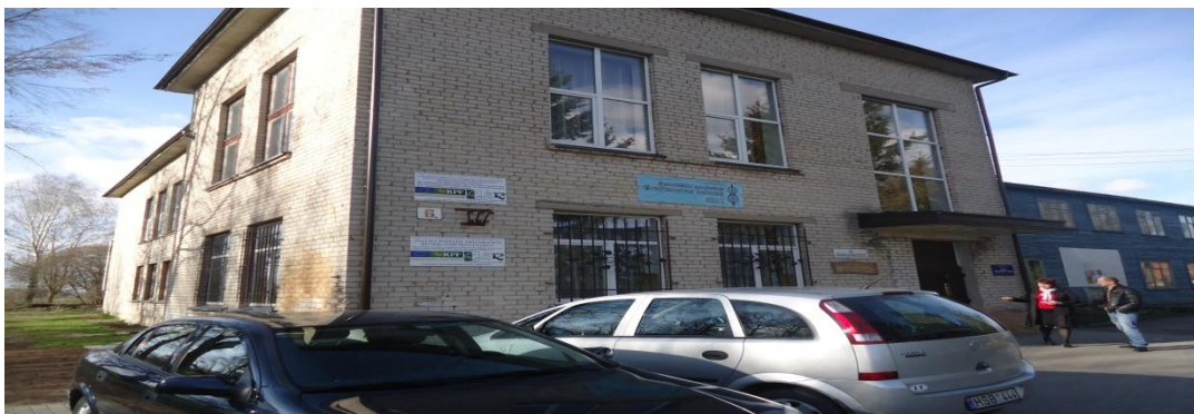
6. Nuotrauka . Karčemų kultūros bendruomenės namai.

I. Grigaliūnaitės, fotografuota Karčemų k., Radviliškio r. 2015 04 23