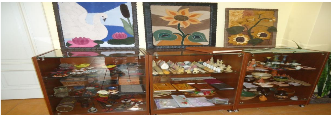
12. Nuotrauka . Pakiršinio etninės kultūros ir amatų centras.

I. Grigaliūnaitės, fotografuota Pakiršinio k., Radviliškio r. 2015 04 23