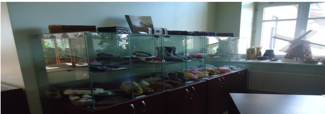
9. Nuotrauka . Pakiršinio etninės kultūros ir amatų centras.

I. Grigaliūnaitės, fotografuota Pakiršinio k., Radviliškio r. 2015 04 23