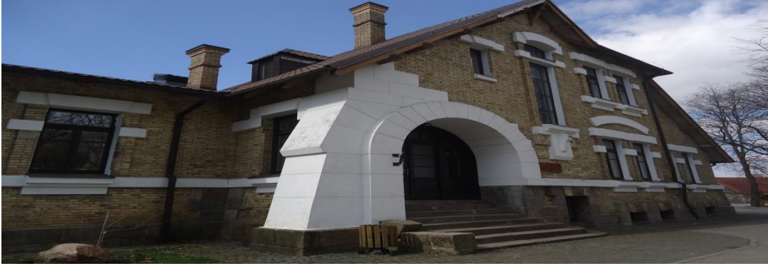
7. Nuotrauka . Pakiršinio etninės kultūros ir amatų centras.

I. Grigaliūnaitės, fotografuota Pakiršinio k., Radviliškio r. 2015 04 23