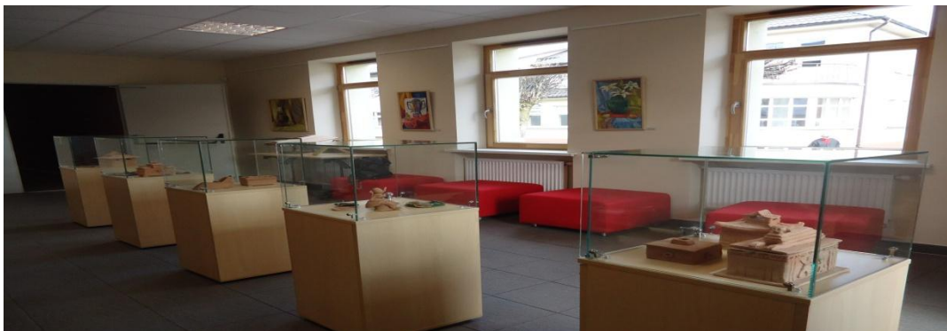
24. Nuotrauka . Šeduvos kultūros ir amatų centras.

I. Grigaliūnaitės, fotografuota Šeduva., Radviliškio r. 2015 04 23