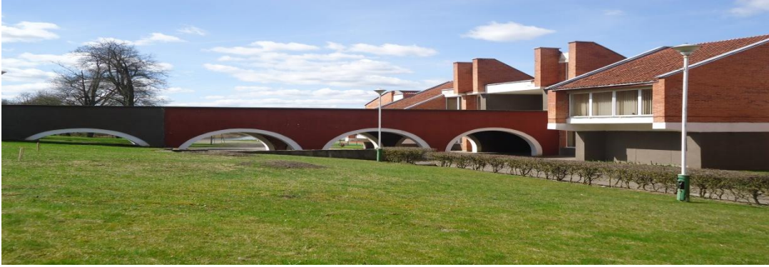
16. Nuotrauka . Raudondvario kultūros namai.

I. Grigaliūnaitės, fotografuota Raudondvario k., Radviliškio r. 2015 04 23