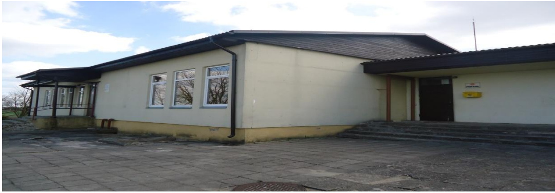
19. Nuotrauka . Skėmių šokių ir pramogų salė.

I. Grigaliūnaitės, fotografuota Skėmių k., Radviliškio r. 2015 04 23