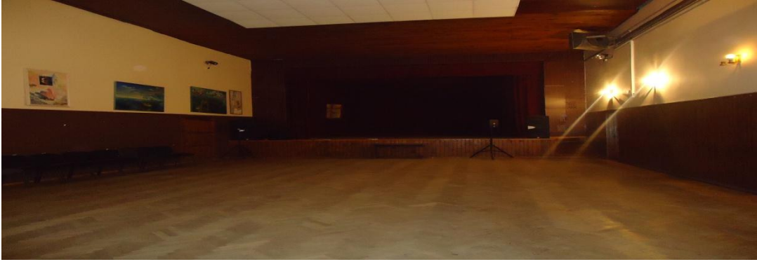
13. Nuotrauka . Pašušvio kultūros namai.

I. Grigaliūnaitės, fotografuota Pašušvio k., Radviliškio r. 2015 04 23