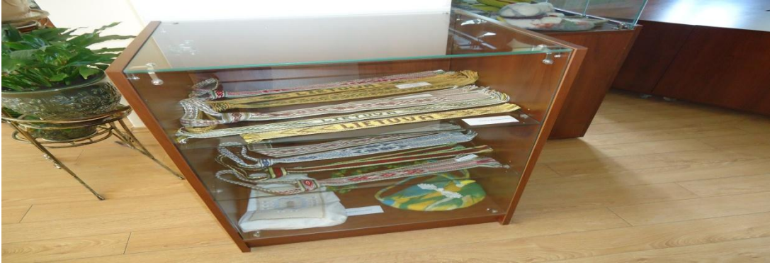
10. Nuotrauka . Pakiršinio etninės kultūros ir amatų centras.

I. Grigaliūnaitės, fotografuota Pakiršinio k., Radviliškio r. 2015 04 23