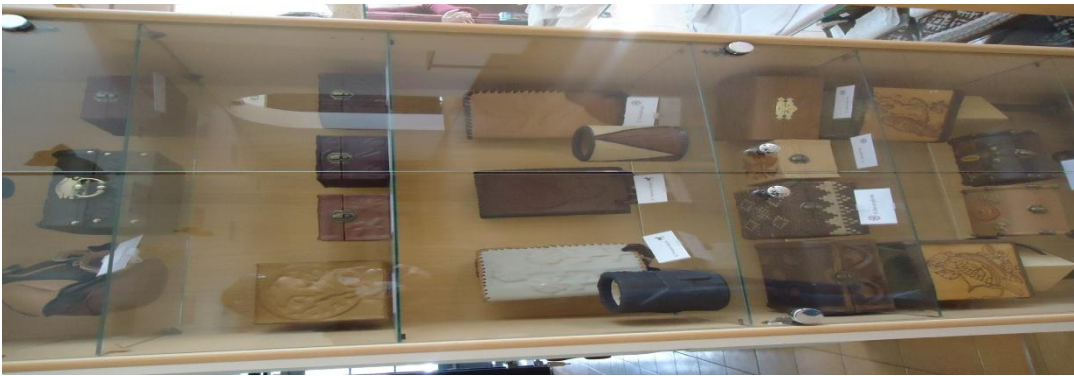
11. Nuotrauka . Pakiršinio etninės kultūros ir amatų centras.

I. Grigaliūnaitės, fotografuota Pakiršinio k., Radviliškio r. 2015 04 23