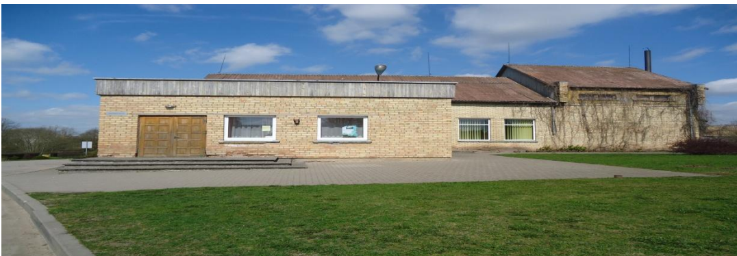
15. Nuotrauka . Pociunėlių kultūros namai.

I. Grigaliūnaitės, fotografuota Pašušvio k., Radviliškio r. 2015 04 23