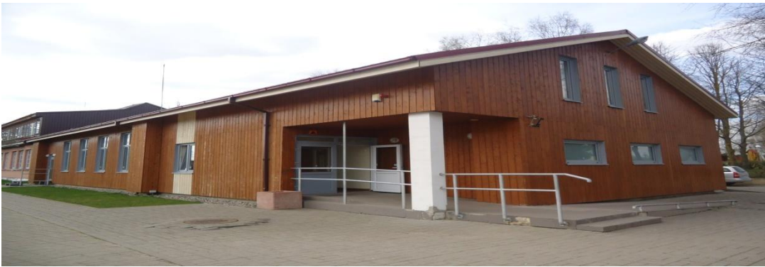
17. Nuotrauka . Sidabravo kultūros namai.

I. Grigaliūnaitės, fotografuota Raudondvario k., Radviliškio r. 2015 04 23