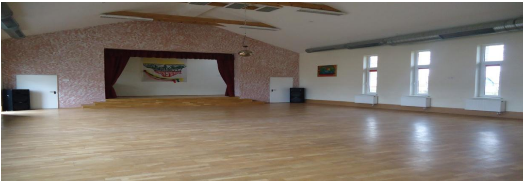
18. Nuotrauka . Sidabravo kultūros namai.

I. Grigaliūnaitės, fotografuota Sidabravo k., Radviliškio r. 2015 04 23