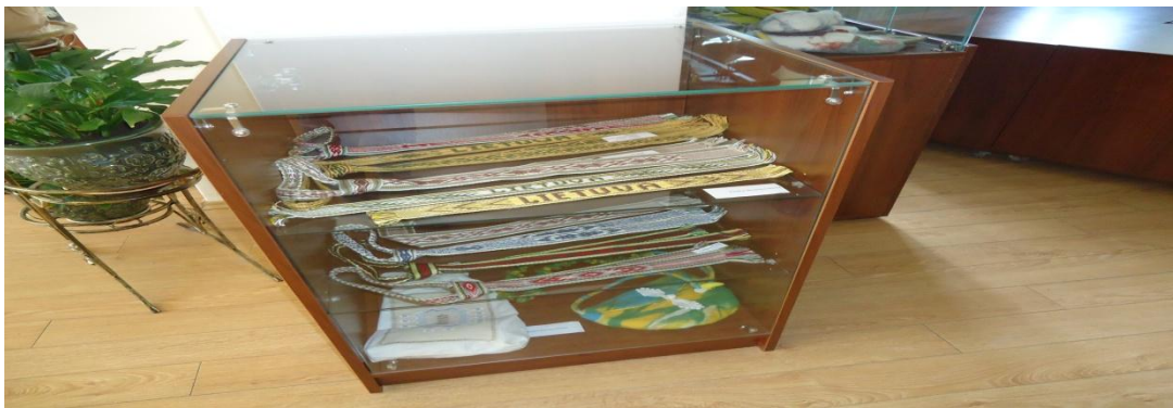
26. Nuotrauka . Šeduvos kultūros ir amatų centras.

I. Grigaliūnaitės, fotografuota Šeduva., Radviliškio r. 2015 04 23