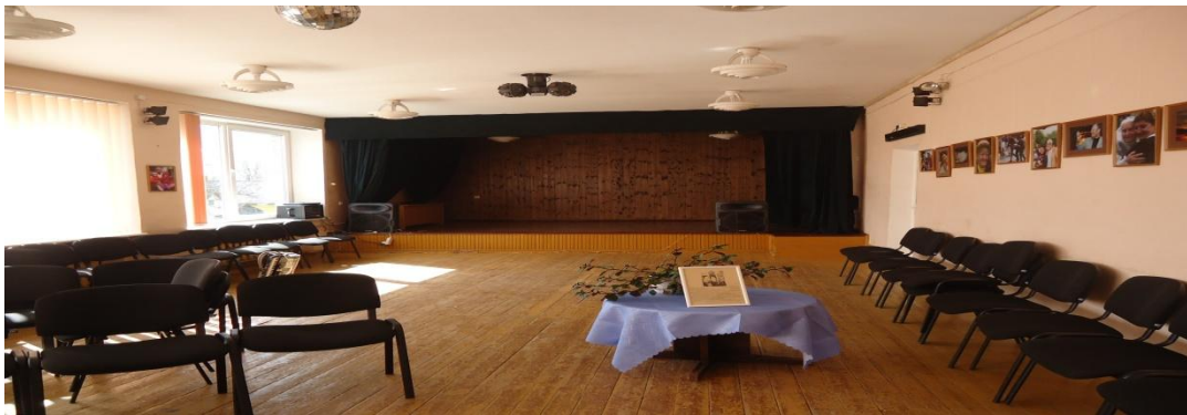
4. Nuotrauka. Grinkiškio pramogų ir šokių salė.

Grinkiškio k., Radviliškio r. 2015 04 23