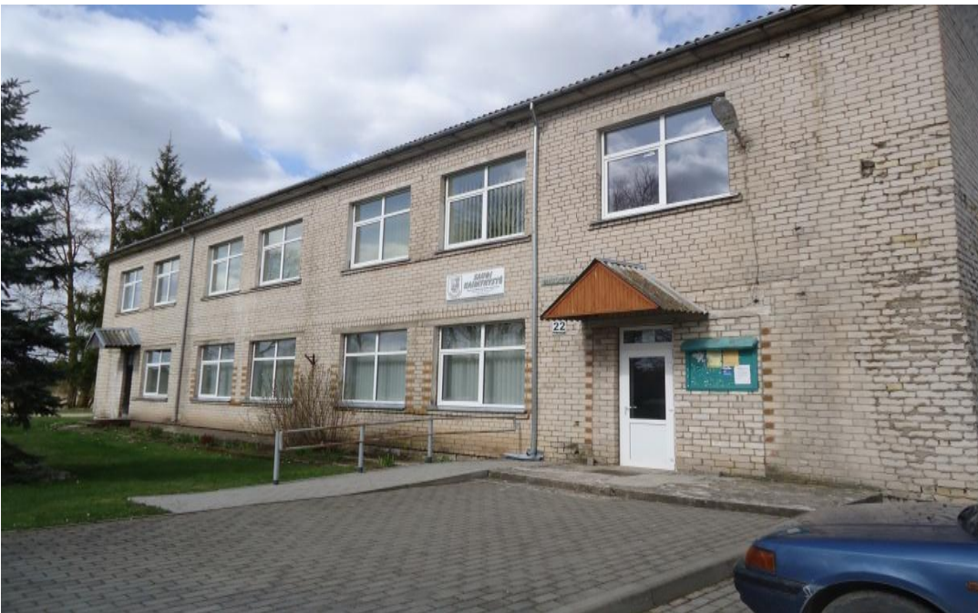
29. Nuotrauka . Vadaktų šokių ir pramogų salė.

I. Grigaliūnaitės, fotografuota Šiaulėnai., Radviliškio r. 2015 04 23