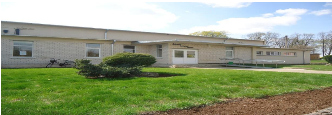
21. Nuotrauka . Šaukoto kultūros namai.

I. Grigaliūnaitės, fotografuota Skėmių k., Radviliškio r. 2015 04 23