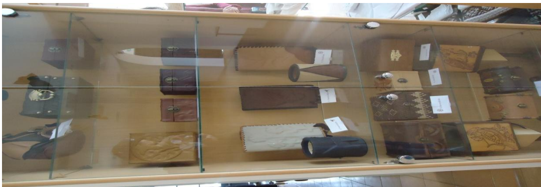
27. Nuotrauka . Šeduvos kultūros ir amatų centras.

I. Grigaliūnaitės, fotografuota Šeduva., Radviliškio r. 2015 04 23