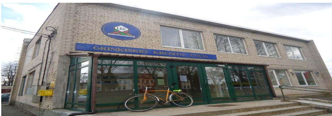
3. Nuotrauka. Grinkiškio pramogų ir šokių salė.

I. Grigaliūnaitės, fotografuota Aukštelkų k., Radviliškio r. 2015 04 23.