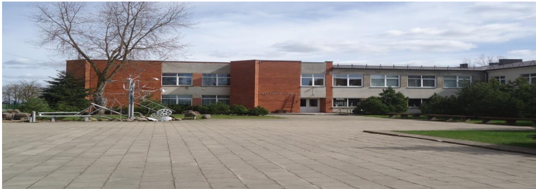
1. Nuotrauka. Alksnupių kultūros namai.

I. Grigaliūnaitės, fotografuota Alksnupių k., Radviliškio r. 2015 04 23.