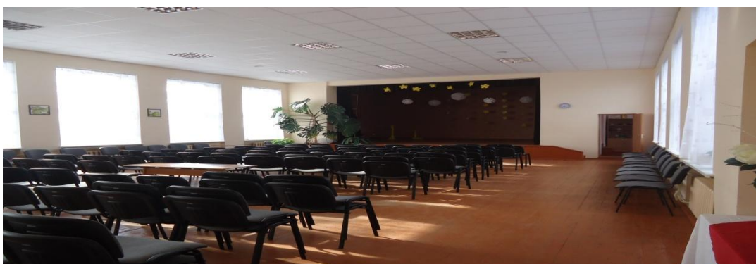
5. Nuotrauka . Karčemų kultūros bendruomenės namai.

Grinkiškio k., Radviliškio r. 2015 04 23