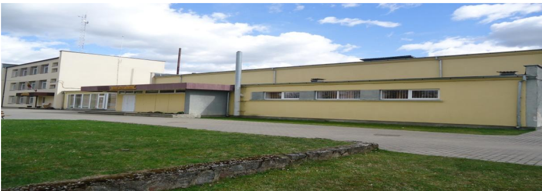
15. Nuotrauka . Pašušvio kultūros namai.

I. Grigaliūnaitės, fotografuota Pašušvio k., Radviliškio r. 2015 04 23