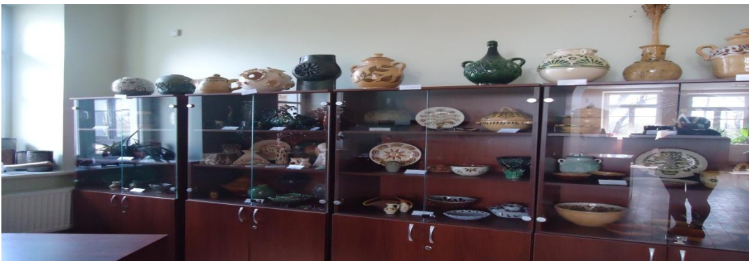
8. Nuotrauka . Pakiršinio etninės kultūros ir amatų centras.

I. Grigaliūnaitės, fotografuota Pakiršinio k., Radviliškio r. 2015 04 23