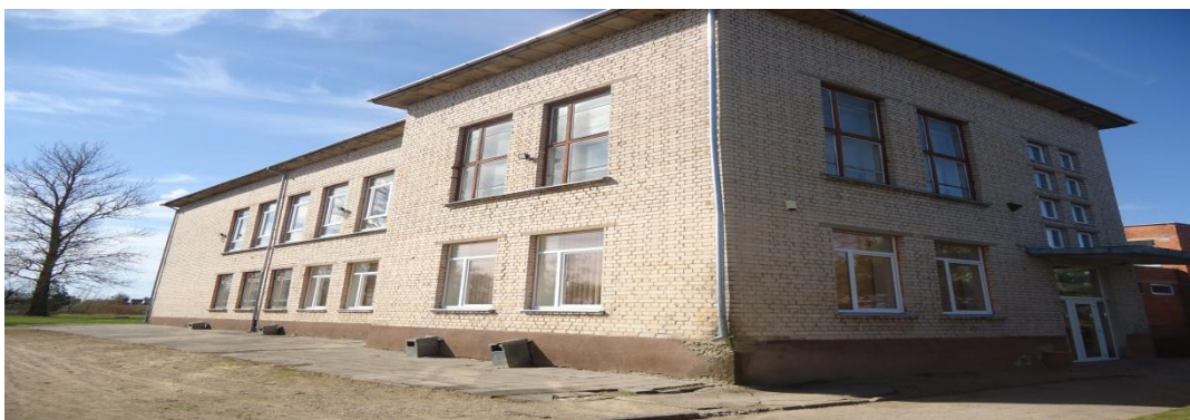
2. Nuotrauka. Aukštelkų kultūros rumai.

I. Grigaliūnaitės, fotografuota Alksnupių k., Radviliškio r. 2015 04 23.