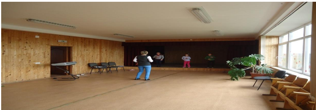
20. Nuotrauka . Skėmių šokių ir pramogų salė.

I. Grigaliūnaitės, fotografuota Skėmių k., Radviliškio r. 2015 04 23