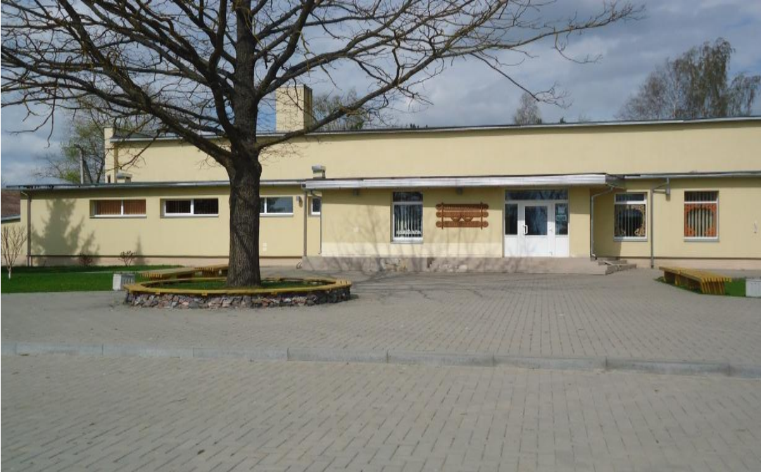
28. Nuotrauka . Šiaulėnų kultūros namai.

I. Grigaliūnaitės, fotografuota Šiaulėnai., Radviliškio r. 2015 04 23