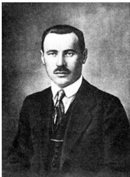
J. Tubelis Žemės ūkio ir Valstybės Turtų Ministeris (I, II, IV ir V Kabinete) | Minister of Agriculture, Domains and Forests (first, second, fourth and fifth Cabinet).

Gimė pasiturinčio ūkininko šeimoje. Pradžios mokslus išėjo rusiškoje Panemunėlio mokykloje. 1893 m. pradėjo mokytis Mintaujos gimnazijoje, tačiau už pasipriešinimą gimnazijos rusifikatorių reikalavimui maldą skaityti rusiškai 1896 m. pašalintas iš mokyklos.