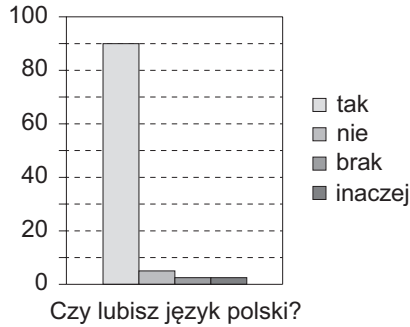
Wykres 3. Stosunek do języka polskiego