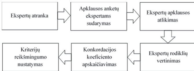
1 pav. Ekspertinio tyrimo etapai

Vienas svarbiausių etapų, taikant daugiakriterį metodą, yra kriterijų reikšmingumo nustatymas, kuris nurodo tam tikro rodiklio svarbą nagrinėjamam reiškiniui. Rodiklių reikšmingumas nustatomas subjektyviu svorių nustatymo metodu. Subjektyvus svorių nustatymas grindžiamas ekspertų vertinimu, kuris kiekvieno eksperto gali būti skirtingas. Ekspertinio tyrimo etapai pateikti 1 paveiksle. Nustatant rodiklių reikšmingumą, buvo pakviesti ekspertai iš įvairių sričių, turintys tiek teorinių žinių, tiek praktinės patirties, nagrinėjant ir sprendžiant neįgalijų užimtumo problemas įdarbinimo ir skurdo mažinimo kontekste. Remiantis teoriniu pagrindimu, nuspręsta, kad tyrime turi dalyvauti ne mažiau nei aštuoni ekspertai, todėl buvo sudarytas galimų ekspertų sąrašas.